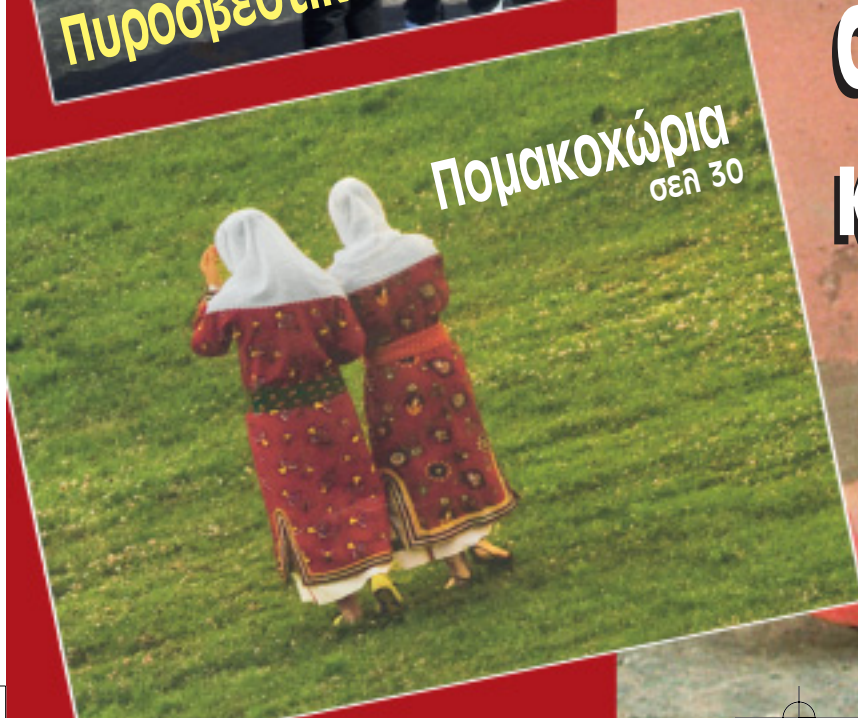
Πομακοχώρια σελ 30