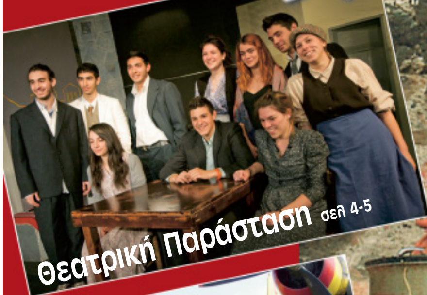
Θεατρική Παράσταση σελ 4-5