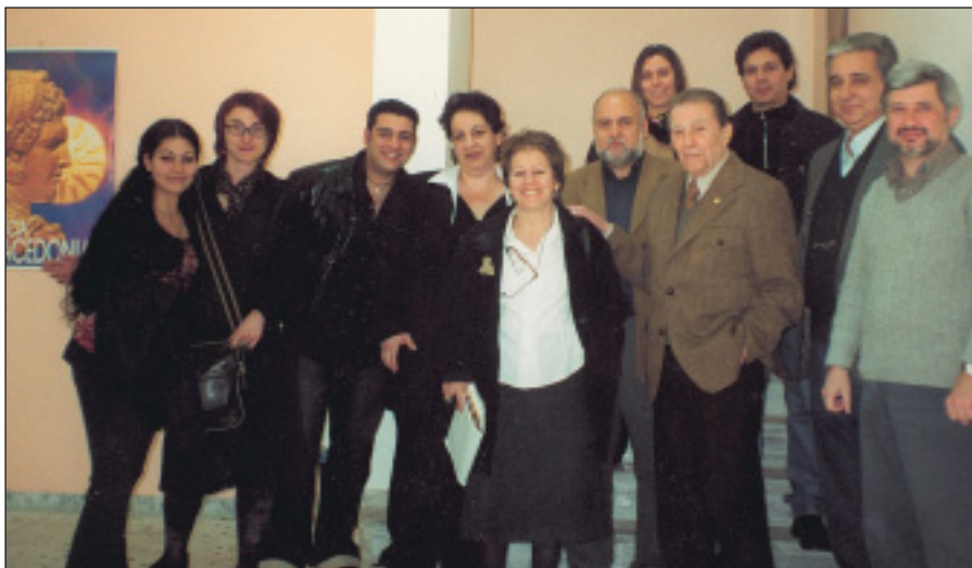
Απρίλιος 2003. Από την επίσκεψη του Ιάκωβου Καμπανέλη στο σχολείο μας, με την ευκαιρία της θεατρικής παράστασης «Η αυλή των θαυμάτων». Διακρίνεται τρίτος από δεξιά ανάμεσα σε καθηγητές και μαθητές.

Είμαι η ζωή μας ένα "Παραμύθι χωρίς όνομα" ή "Χορός πάνω στα στάχυα"; Μήπως κατοικούμε στην "Αποικία των τιμωρημένων" ή στην "Αυλή των θαυμάτων"; Ίσως κάποιες φορές μετράμε την "Ηλικία της νύχτας" στη "Γειτονιά των αγγέλων", σα να 'ναι "Μια συνάντηση κάπου αλλού". Άλλοτε πάλι, "Ο εχθρός λαός" απορεί με "Το μεγάλο μας τσίρκο". Όμως, "Ο αόρατος θίασος" πάντοτε καταλήγει στα "Τέσσερα πόδια του τραπέζιού", καθώς "Στη χώρα του Ίψεν" η "Στέλλα με τα κόκκινα γάντια" εξιστορεί την "Έβδομη μέρα της δημιουργίας". "Ο δρόμος περνά από μέσα" και μας οδηγεί στον θεατρικό συγγραφέα και ακαδημαϊκό, Ιάκωβο Καμπα-