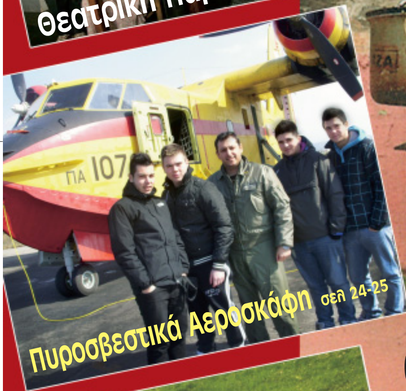
Πυροσβεστικά Αεροσκάφη σελ 24-25